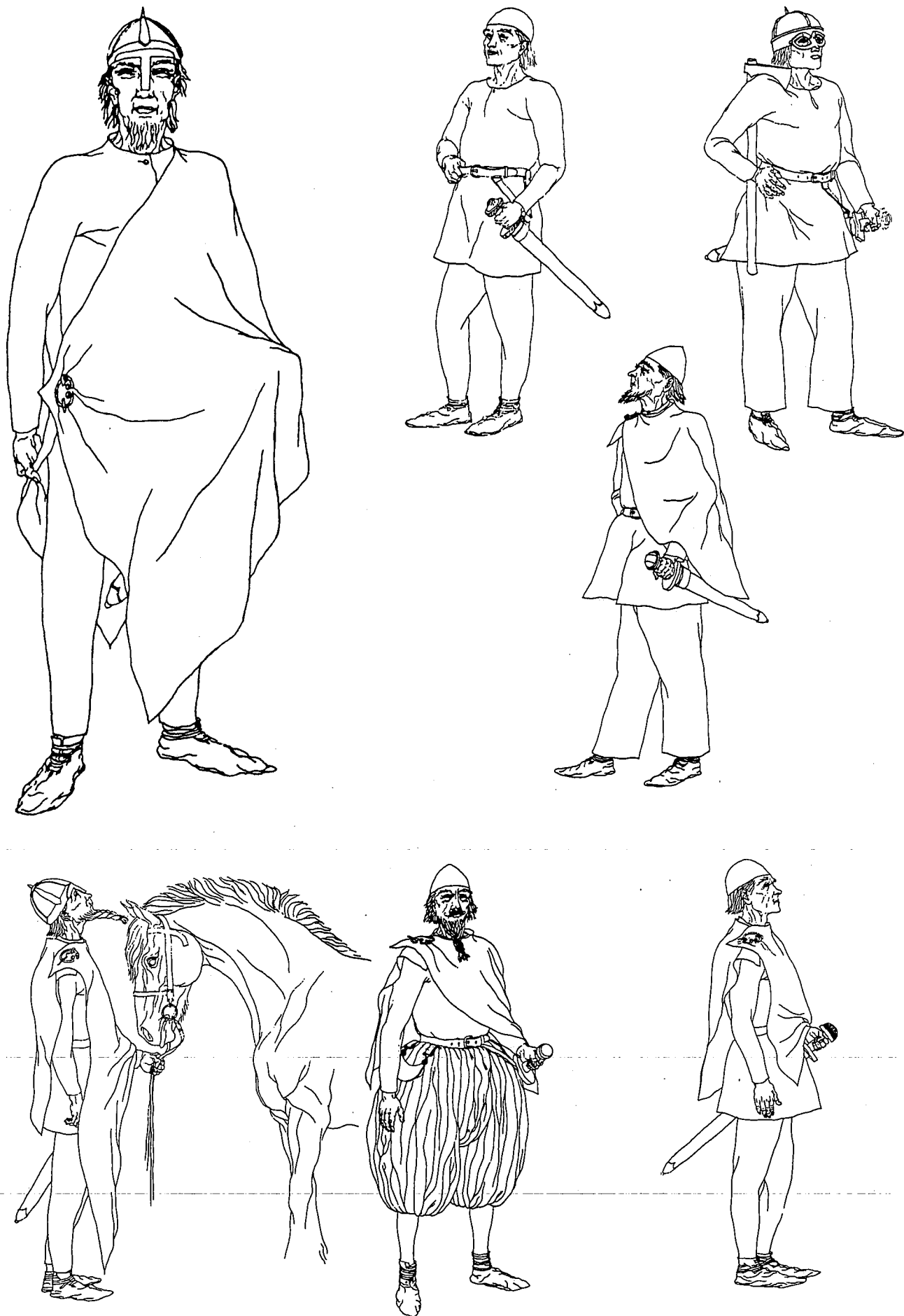
COSTUMES VIKINGS. La deuxième vague des invasions vikings en Normandie se situe fin Xe - début XI e siècles. -- Documentation: DE VIKINGEN, Ed. Uitgeverij Orion. Brugge.